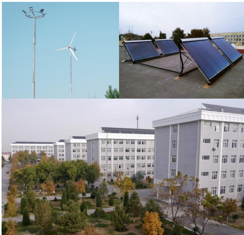
1-rasm. Qayta tiklanadigan energiya manbalaridan foydalanish

Ushbu yondashuv institutning energiya tejamkorligini oshirish bo'yicha uzoq muddatli strategiyasining ajralmas qismi bo'lib, zamonaviy texnologiyalarni joriy etish orqali atrof-muhitga ijobiy ta'sir ko'rsatmoqda.